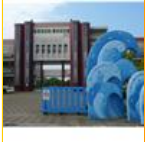
您好！縣立天南國小 (134697)