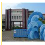
您好！縣立天南國小 (134697)